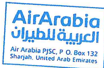
رئيس مجلس الإدارة

وبينما نتطلع قدماً إلى ما ينتظرنا في المستقبل القريب، فإننا متفائلين بشأن آفاق قطاع السفر الجوي منخفض التكلفة وقدرتنا في الحفاظ على أداءنا القوي مع مواصلة النمو وتوسيع عملياتنا التشغيلية.