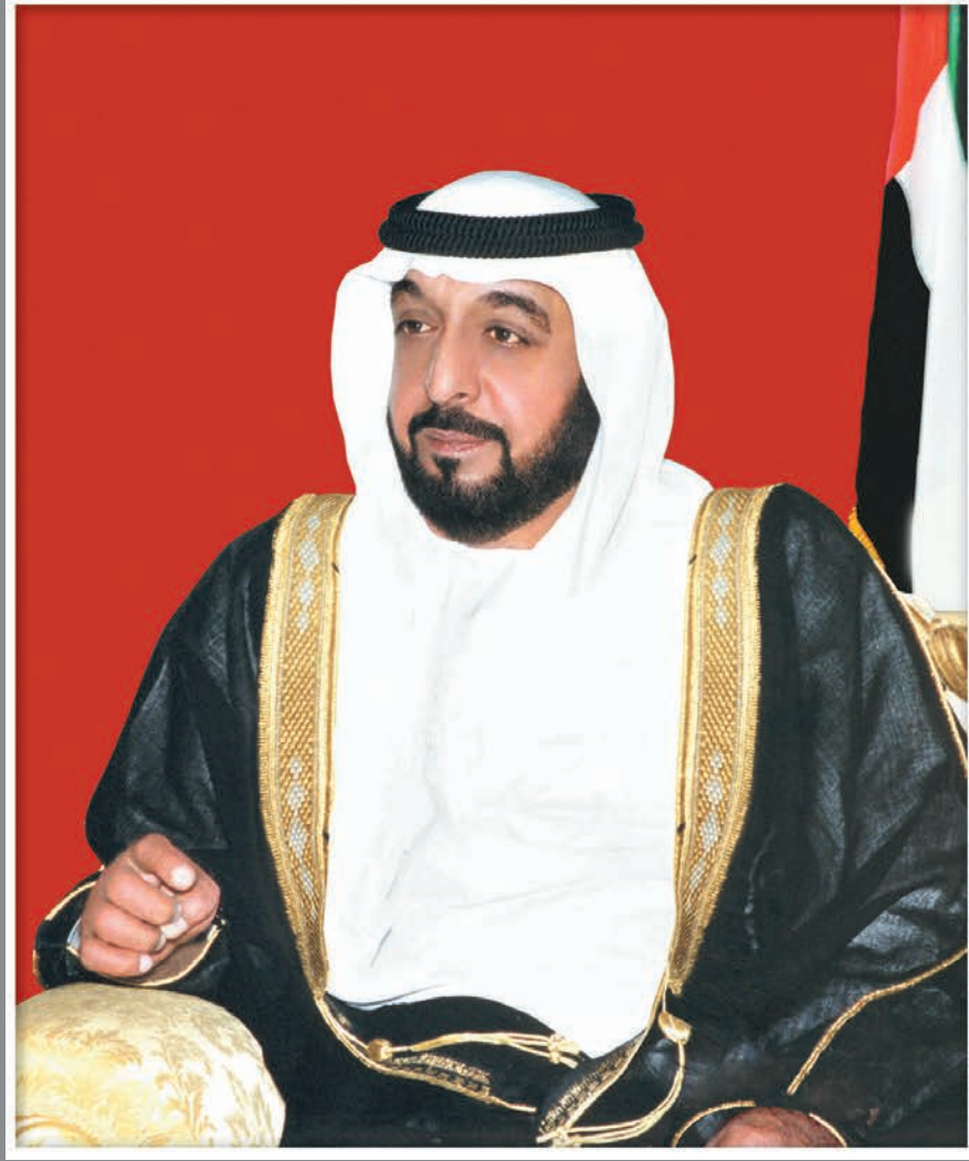
صاحب السمو الشيخ خليفة بن زايد آل نهيان رئيس دولة الإمارات العربية المتحدة - حفظه الله