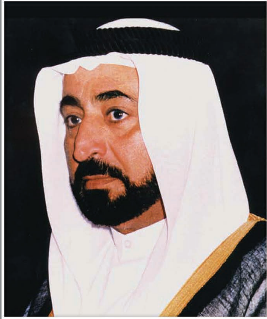
صاحب السمو الشيخ الدكتور سلطان بن محمد القاسمي عضو المجلس الأعلى حاكم الشارقة